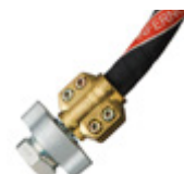
Slangen en koppelingen