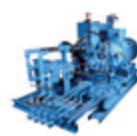
Hydraulische componenten en leidingcomponenten