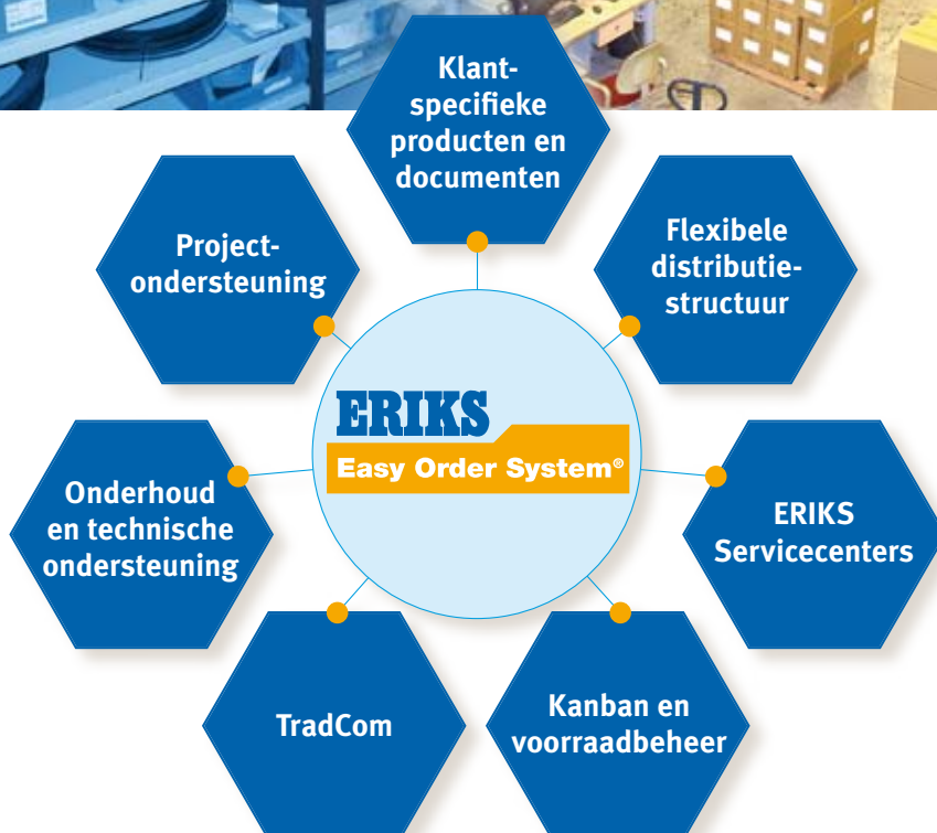
Total Cost of Supply

Het Easy Order System ® vertegenwoordigt een breed pakket van goed ontwikkelde logistieke diensten en elektronische communicatie, gericht op verlaging van de total cost of ownership (TCO) bij onze klanten. Gedreven door technische kennis wordt het inkoopproces sterk vereenvoudigd en het aantal toeleveranciers verder teruggedrongen. Hiermee worden kostenbesparingen van 20% tot soms wel 40% van het inkoopbudget gerealiseerd.